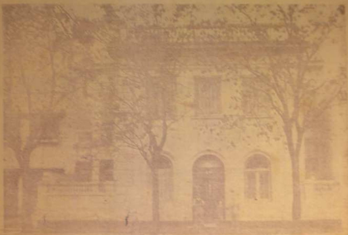
VISTA DEL FRENTE DE NUESTRA NUEVA SEDE CENTRAL

Una reunión de la Unión Petrolera Argentina, se celebró en la Avenida Social, el día 15 de mayo, en la ciudad de Buenos Aires. La reunión fue presidida por la Compañera Evita Perón, esposa del Comandante en Jefe del Ejército Argentino, General San Martín Perón, y sus hijos.