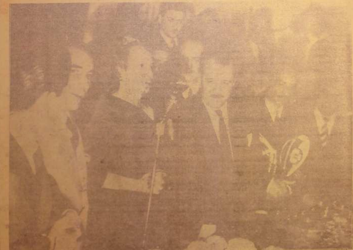
EVA PERON dirige la palabra a la concurrencia en el acto de inauguración de nuestra sede central