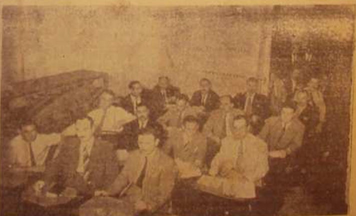
Delegados al Congreso Extraordinario en sus banquetas (ala derecha)