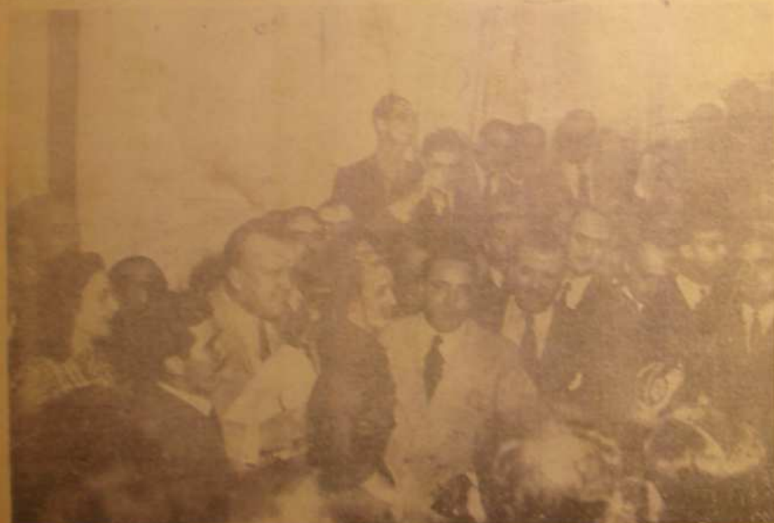
MOMENTO EN QUE LLEGA SUYA PERÓN AL SITIO DE HONOR

Una reunión de la Unión Petrolera Argentina, se celebró en la Avenida Social, el día 15 de mayo, en la ciudad de Buenos Aires. La reunión fue presidida por la Compañera Evita Perón, esposa del Comandante en Jefe del Ejército Argentino, General San Martín Perón, y sus hijos.