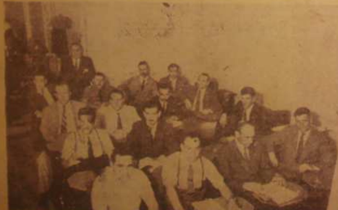
Vista del ala izquierda del Congreso Extraordinario

El H. Congreso de la U. P. A. resuelve: Dar a publicidad el despacho mencionado, tal cual lo aprobó este Honorable Congreso. Por la Comisión de Despacho hay cinco firmas. (Continúa en la pág. 14)